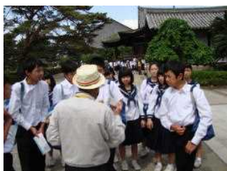
法隆寺奇数チーム