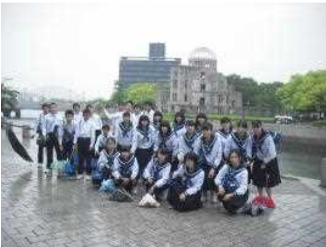
原爆ドームを背景に