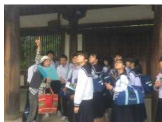
法隆寺偶数チーム