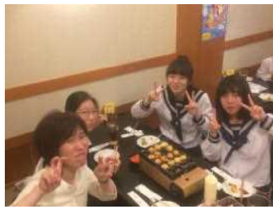
上手に焼けました！