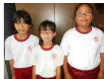
4年Sさん、3年Tさん、5年Fさん

6月25日の予選を勝ち抜き8月5日に行われる第8回全日本女子相撲郡上大会に出場します。県代表として頑張ります。